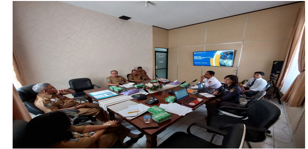
Rapat Optimalisasi Monitoring, Evaluasi dan Pelaporan pelaksanaan Ketahanan Ekonomi, Sosial Budaya, Agama dan Ormas bertempat di Ruang (Vicon) Badan Kesbangpol Prov. Kalteng Tahun 2023