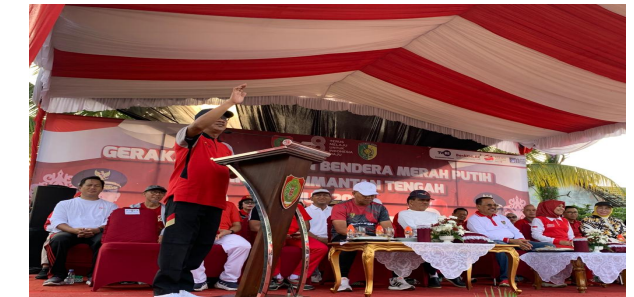
Gerakan Pembagian Bendera Merah Putih Di depan TVRI Kalteng Tahun 2023